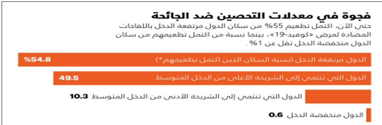
شكل (2) يوضح الفجوة في معدلات التحصين ضد الجائحة بين شعوب الدول الغنية والمتوسطة والفقيرة

وسيؤدي عدم الإنصاف في توزيع اللقاحات إلى ضرر اقتصادي كبير من شأنه أن يعرض التقدم الاقتصادي المحرز على مدى عقود من الزمن للخطر لجميع دول العالم المتقدم والنامي. في المقابل يؤدي التوزيع المنصف للقاحات كوفيد-19 إلى تحقيق فوائد اقتصادية لا تقل عن 153 مليار دولار أمريكي في الفترة 2020-2021، ونحو 466 مليار دولار بحلول عام 2025 في 10 من الاقتصادات الرئيسية في العالم.